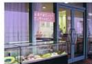
●カルチャーセンター(2F)