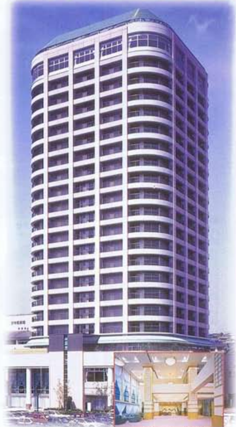
●エントランスホール(1F)