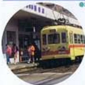
●筑豊電鉄通谷電停