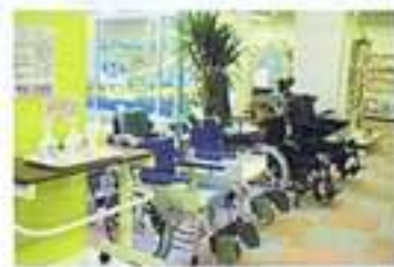
●介護用品ショップ(1F)