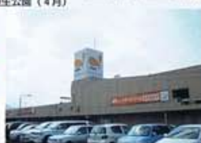
●ショッピングモールながま