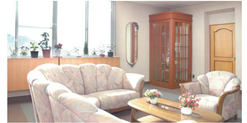
●談話室 お友達やご家族との会話などご自由にお使いください。

市内を一望できる自然に恵まれた環境に位置し、健康的な生活を送っていただくため、バラエティに富んだ食事の提供、毎日の生活・健康についての相談、趣味を活かした各種クラブ活動、自由に参加できるレクリエーション行事等を実施しています。