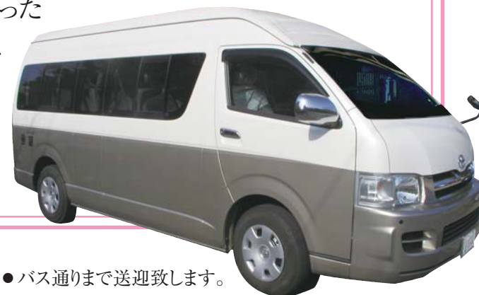
● バス通りまで送迎致します。