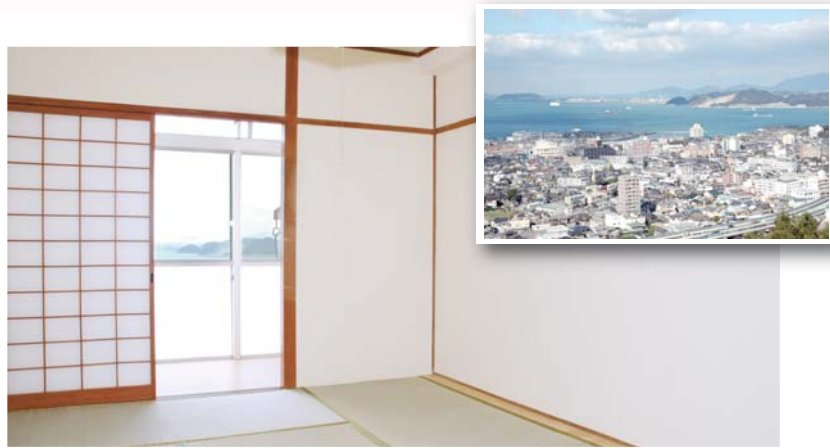
●居室 窓からは玄界灘が一望できます。