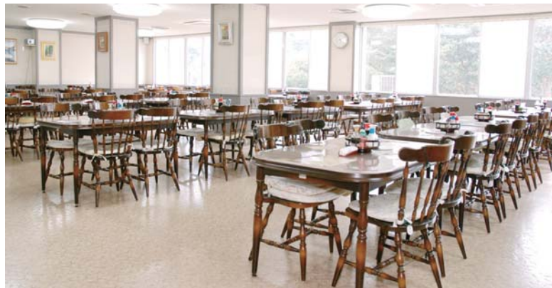
●食堂 広いスペースでゆっくりと食事がとれます。栄養士の管理により、バランスのとれた食事を提供致します。